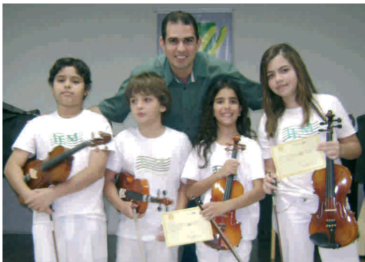
Professor e alunos após apresentação no IEM.