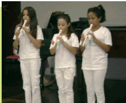
Alunos em apresentação no IEM.

Assim, as crianças e jovens que vivem a música, sentem-se com certeza mais equilibradas e, conseqüentemente, mais saudáveis!